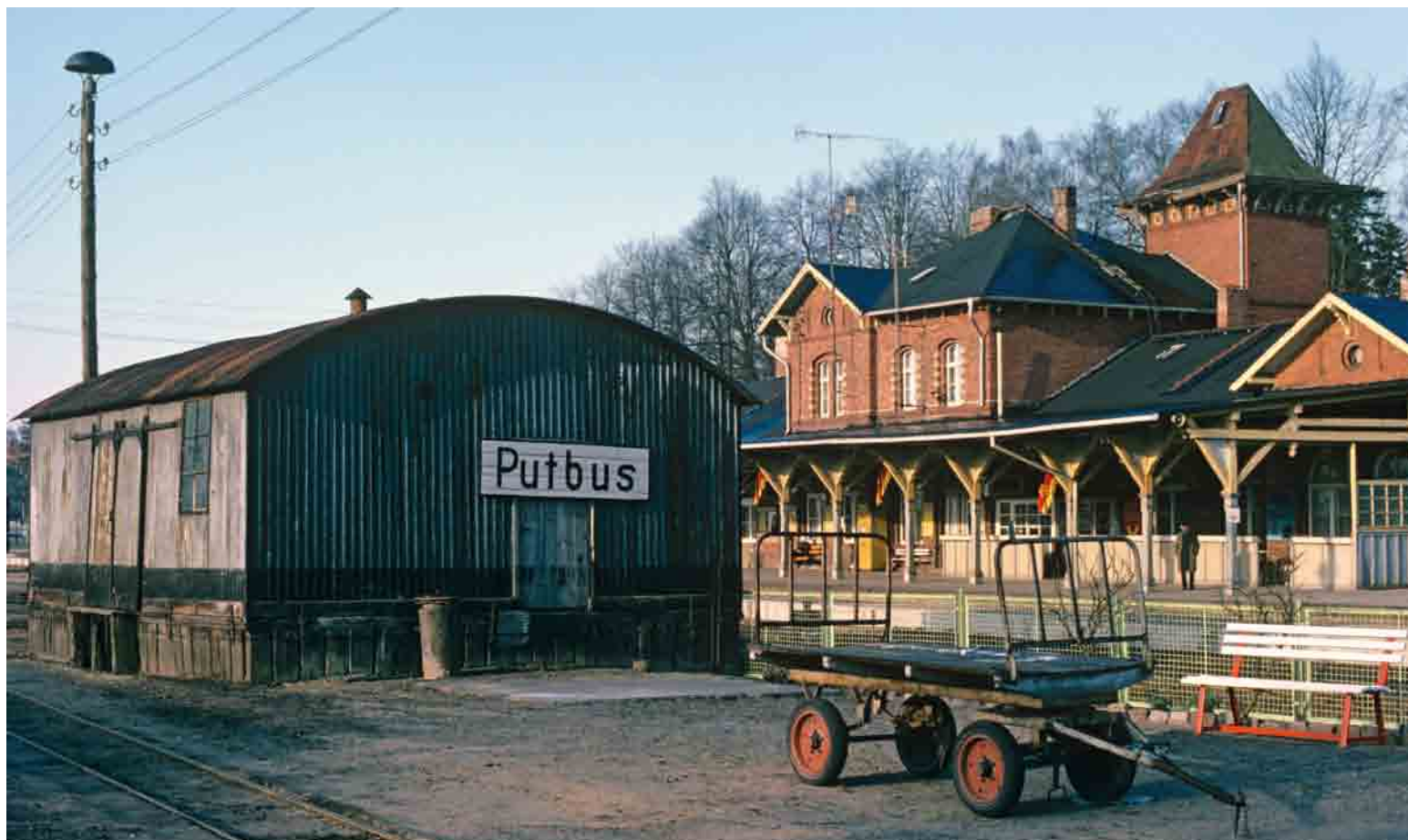
Smalsporsbanens pakhus med normalsporsstationen i baggrunden.