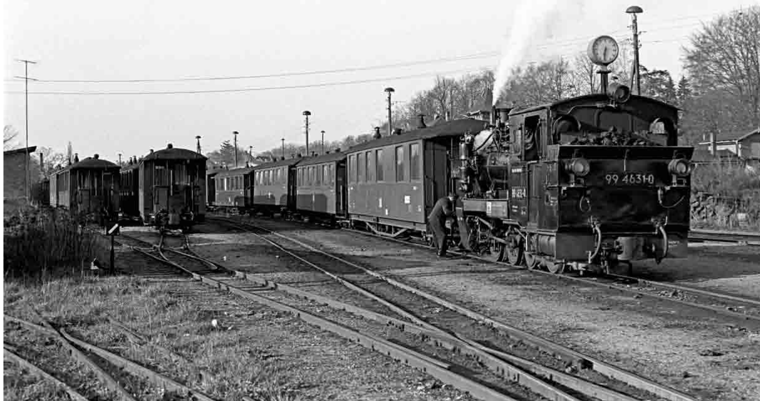
99 4631-0 holder klar til at afgå fra Putbus med tog 14105.