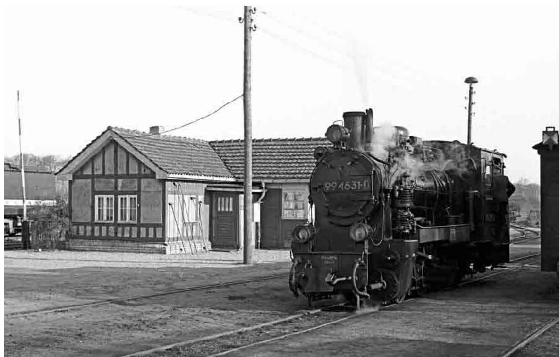
99 4631-0 rangerer i Putbus.