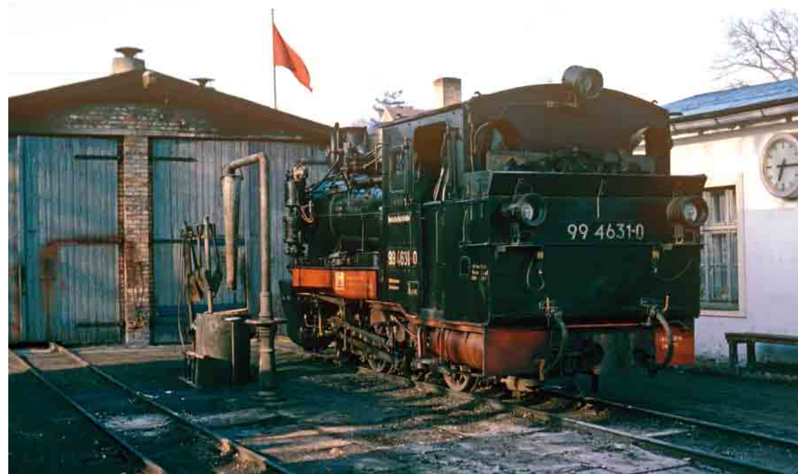
99 4631-0 ved remisen i Putbus den 4. maj 1978.

Rügen und Usedom auf einem Kartenausschnitt mit den Campingplätzen der DDR. Die Verkehrsvertretung der DDR in Kopenhagen gab eine Broschüre über das Campen in der DDR heraus, in der die hier gezeigte Lebensmittelpreisliste und ein Verzeichnis der internationalen Campingplätze enthalten waren.