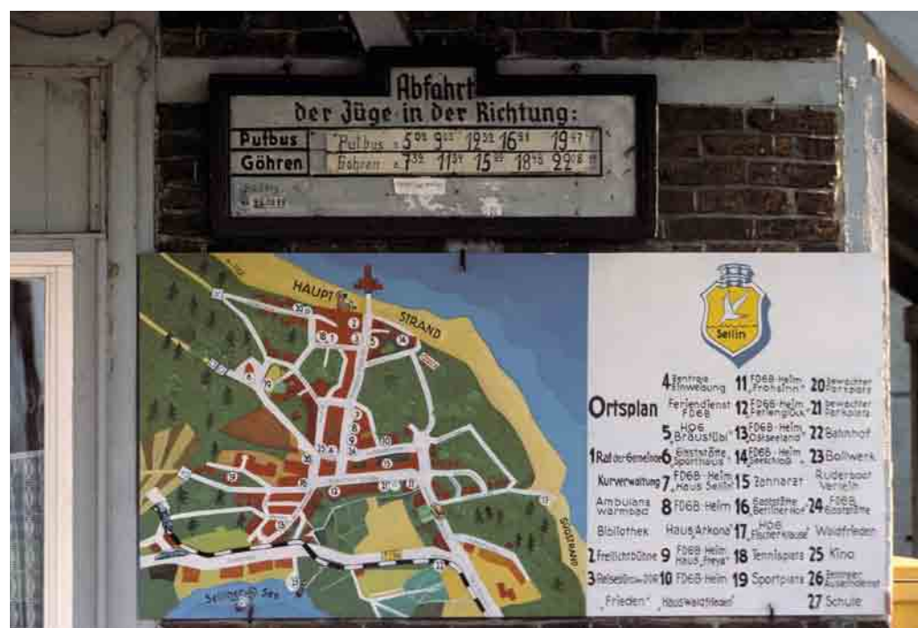
Opslagskøreplan i Sellin.