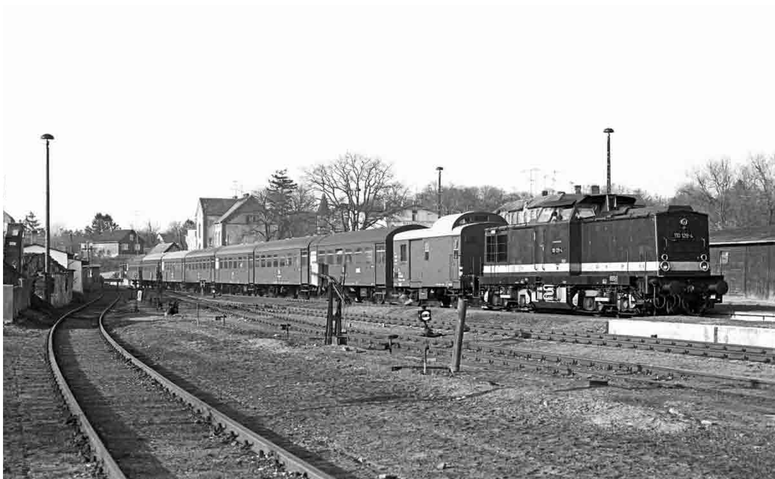
110 129-4 mit Zug 19148 aus Lauterbach vor der Weiterfahrt nach Bergen, aufgenommen am 4. Mai 1978 in Putbus.