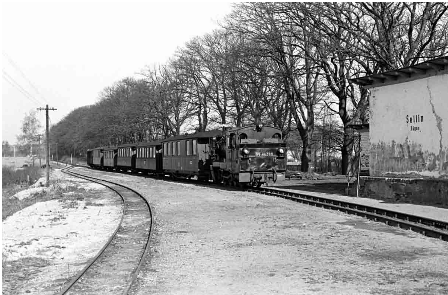
99 4631-0 ankommer til Sellin med tog 14105.