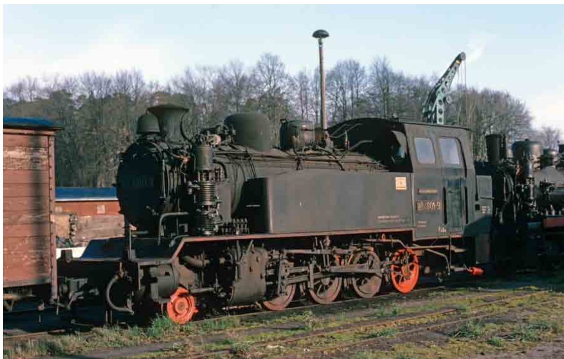
99 4801-9 holder hensat i Putbus.